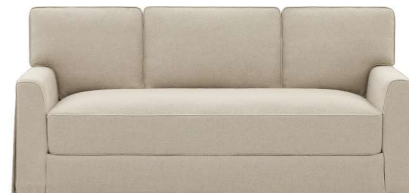
VIVIENNE Canapé - Sofa FVIVICA200

VIVIENNE is a sofa that invites both settling in and letting go, sharing and dreaming, a generous confidant where every moment becomes precious.