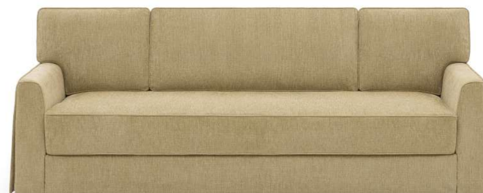
VIVIENNE Canapé - Sofa FVIVICA240