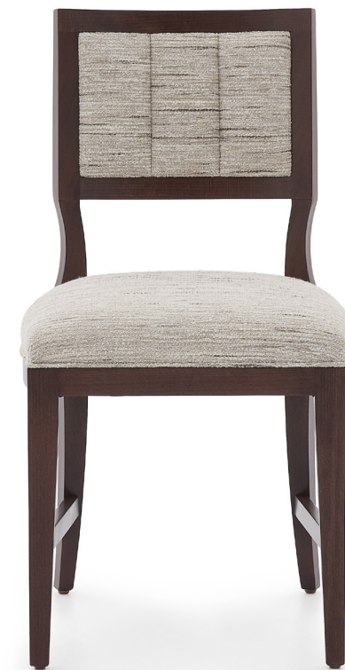
PERETTE Chaise - Chair FPERECH044G - Hêtre / Beech