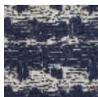
FT200002 Bleu nuit