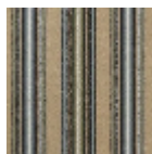
FT254003 Vert d'eau