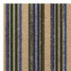
FT254001 Bleu marine