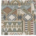
FT262002 Vert d'eau