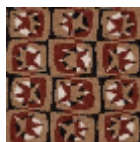
FT316003 TERRE CUITE