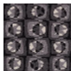
FT316001 NOIR ET BLANC