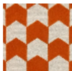
LTI06002 ORANGE/CRÈME ME