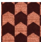
LTI06003 Brique rose