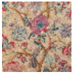
B080A001 Rouge fond crème