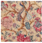
B080A003 Corail jaune