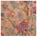
B080A002 Rouge fond bis