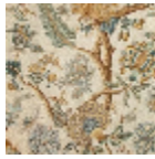
B080A004 Bleu or fond blanc