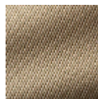
F3261009 Café au lait