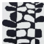
F3485001 Noiret blanc