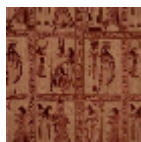
F3654002 Terre cuite