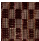
F3660003 Terre cuite