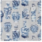
F3806001 Blue porcelain