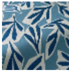
F3829003 Lapis lazuli