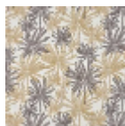
F3837002 Palmier dore