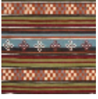
F3966001 MULTICOLOR E