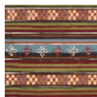
F3966001 MULTICOLOR E