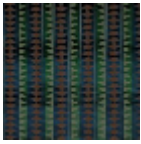
I6631003 agostino reale