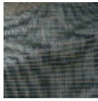
I6662004 BLU ANTICO