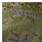
16663001 SMERALDO- ORO