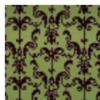
I6665001 VERDE ANTICO