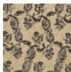
L1688_EGLANT INES_B93_B54 _FB