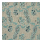
L1688_EGLANT INES_B65_B73 _FM