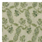
L1688_EGLANT INES_B22_B23 _FA