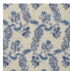
L1688_EGLANT INES_B53_B21_ FE