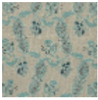
L1688_EGLANT INES_B65_B73 _FM