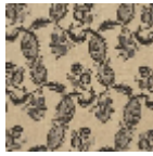
L1688_EGLANT INES_B93_B54 _FB