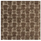
L2407_LES_CH ARDONS_C511_ FE