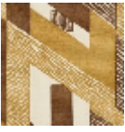
L3569_HYPER BOLE_C515_C5 12_FE