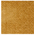
L3845_HOGGA R_C515_FB_VE RSO