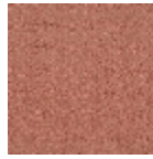
L4172011 Rouge de chine