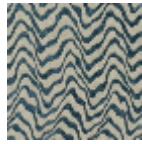
L4541_KENYA_ C534_FM_VER SO