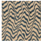
L4541_KENYA_ C534_FB_VER SO