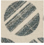
L5024_GRAND _TOKYO_N3137 _FE