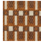
L5055_KUBIC_ N3013_N3161_F G