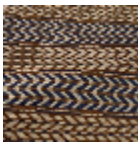
L5065_UBUD_ N3161_N3011_F G