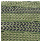
L5065_UBUD_ N3018_N3011_F G