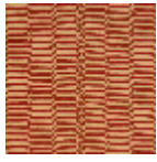
L5067_KATHM ANDU_C514_C 520