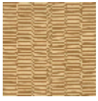
L5067_KATHM ANDU_B87_B5 7