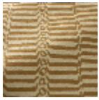
L5067_KATHM ANDU_B87_B5 7