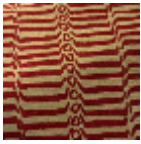
L5067_KATHM ANDU_C514_C 520