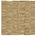
L5067_KATHM ANDU_N3021_ N3006