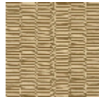
L5067_KATHM ANDU_N3021_ N3006