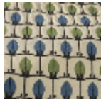
L5070_MENNA _B54_B23_B21_ FE