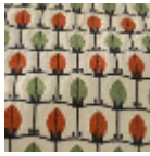
L5070_MENNA _B54_B92_B23_ FE