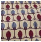
L5070_MENNA _B14_B42_B13_ FE