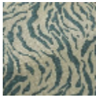
L5075_JAISAL MER_B65_B73 _FA