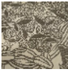
L5076_DRAPE RIES_N3023_N 3002_FE