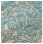
L5076_DRAPE RIES_B73_B37 _FE