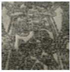
L5076_DRAPE RIES_C544_C5 08_FM