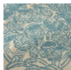
L5076_DRAPE RIES_B73_B37 _FE