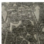
L5076_DRAPE RIES_C544_C5 08_FM