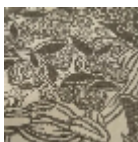
L5076_DRAPE RIES_N3023_N 3002_FE