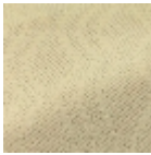
L5080_ENTRE CHAT_N3006_ FE