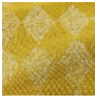
L5084_BRIGH ELLA_N3139_F E