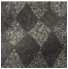
L5084_BRIGH ELLA_B68_B93 _FE