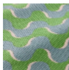
L5086_GROOV Y_N3016_N301 8_FA