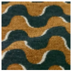
L5086_GROOV Y_C508_C512_F E