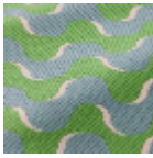
L5086_GROOV Y_N3016_N301 8_FA