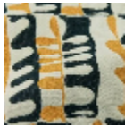
L5087_DJANG O_B58_B54_F E