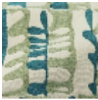
L5087_DJANG O_C535_C544_ FE