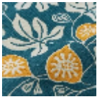
L5088_LE_FIG UIER_B58_B65 _FE