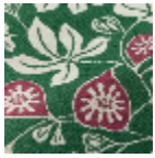
L5088_LE_FIG UIER_B13_B22_ FE