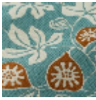
L5088_LE_FIG UIER_N3013_N 3016_FE