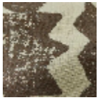
L5094_TALISM AN_B68_B93_ FE