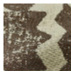
L5094_TALISM AN_B68_B93_ FE