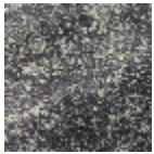
L5095_CEZEM BRE_B68_B93 _FE