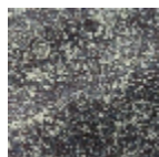
L5095_CEZEM BRE_B68_B93 _FE