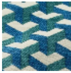
L5096_MAU RIT S_C533_C535_F E