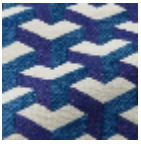
L5096_MAU RIT S_B38_C533_F E