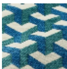
L5096_MAU RIT S_C533_C535_F E