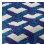
L5096_MAU RIT S_B38_C533_F E