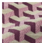
L5096_MAU RIT S_N3012_N300 8_FE