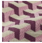
L5096_MAU RIT S_N3012_N300 8_FE