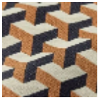
L5096_MAU RIT S_B57_B54_FE