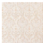
T0698002 Oyster natural