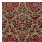
T0709001 Kenya red