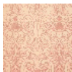
T0718002 NEW TOMATO