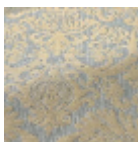
T0719003 Pale blue